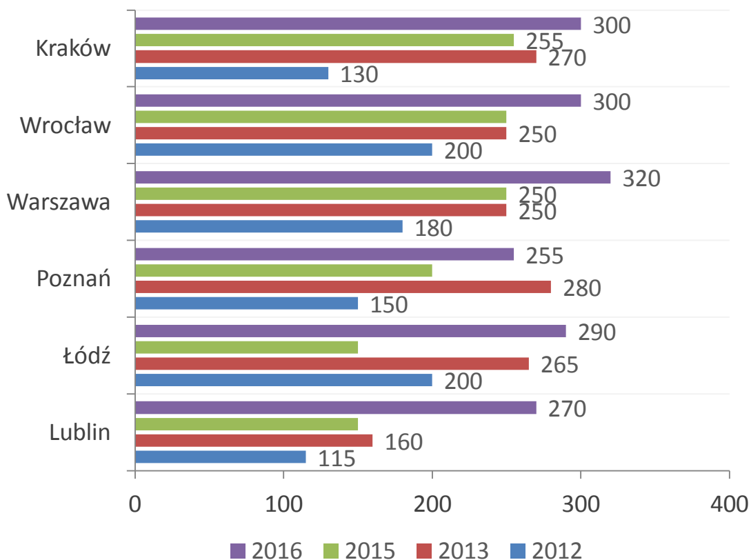
Wykres 2. Maksymalne stawki za odwiedzin w domach pobierane przez Mikołajów w różnych miastach w latach 2012-2016 (w PLN)

Źródło: opracowanie Sedlak & Sedlak na podstawie portali ogłoszeniowych